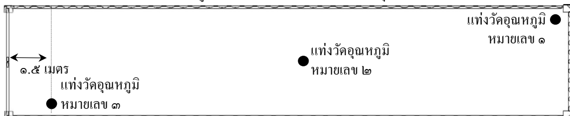
ภาพที่ ๑ ตำแหน่งการวางแท่งวัดอุณหภูมิผลไม้ภายในตู้ขนส่งสินค้าสำหรับการกำจัดศัตรูพืชด้วยความเย็นในระหว่างขนส่ง